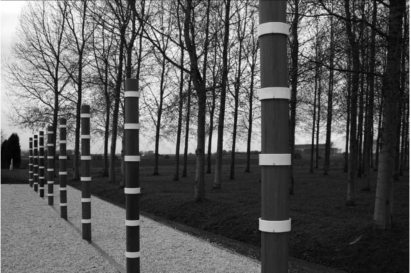
Boekhouten. De dodendraad.